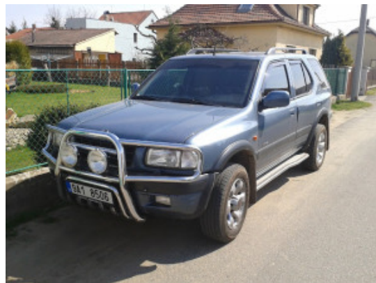
OPEL Frontera B 1999

Máte nějaký jiný fígl, jak vkládáte dva obrázky vedle sebe ve WordPress? Podělte se do komentářů.