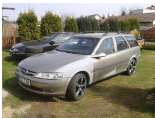
OPEL Vectra B 1997